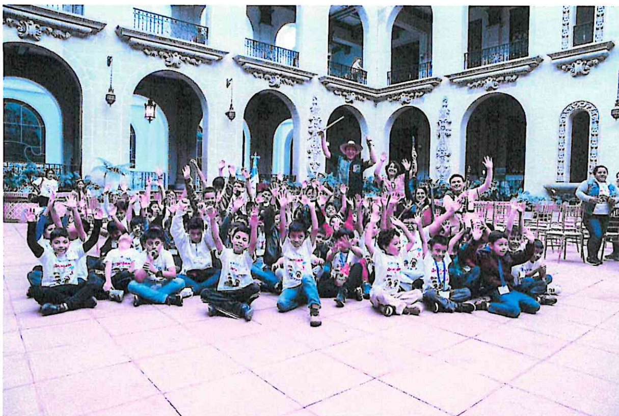
Foto y saludo junto a los estudiantes al finalizar el concierto