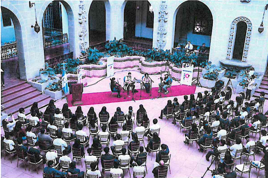
Músicos interpretando "Aires de Sumpango" desde un plano superior con vista panorámica