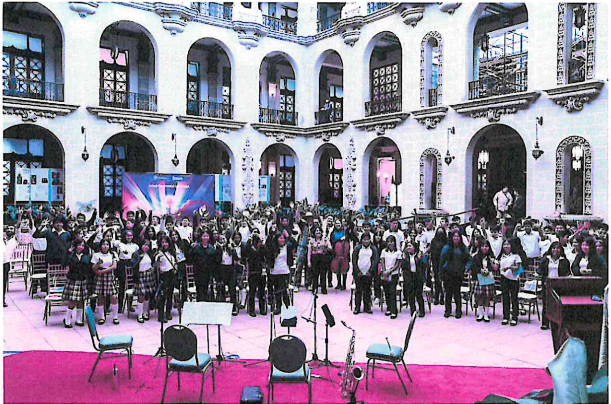
Foto de despedida y cierre del concierto.